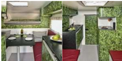
Front mit Alkoven

Die Pickup-Kabine vom Schreiner aus Schwäbisch Hall steht auf der Abenteuer & Allrad ( https://explorer-magazin.com/kalender/abenteuer-allrad-2016/ ) (26.-29.5. 2016) auf Platz Z 52.